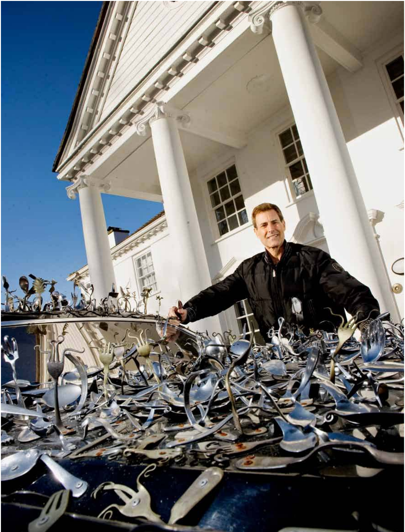
PIMP MY CADILLAC: Denne Cadillacen fra 1976 pimpet opp med om lag 5000 bestikkdeler i alle former og fasonger. Her finnes blant annet skjeer som har tilhørt legender som James Dean, Elvis og Marlon Brando.