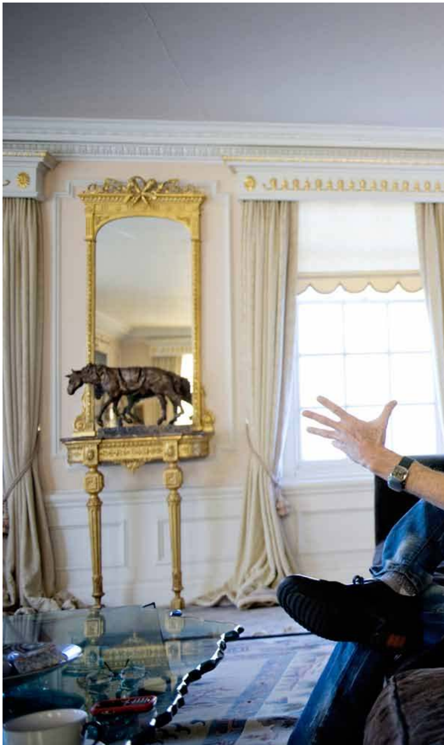
FAST Plass: – Michael elsket å sitte på akkurat denne plassen, sier Uri Geller i det han setter seg ned i den gigantiske sofaen hjemme i Sonning on

URIS ENESTÅENDE EVNER , som skjebøyer, mystiker og en-