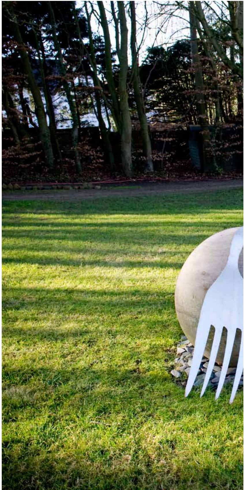
ENERGISK: Uri Geller er en energisk 64-åring. Under fotoseansen utenfor hjemmet hans løper han fra skulptur til skulptur, for å vise oss alle

Han trekker parallellen til de gamle romerne, som var kjent for sine matorgier.