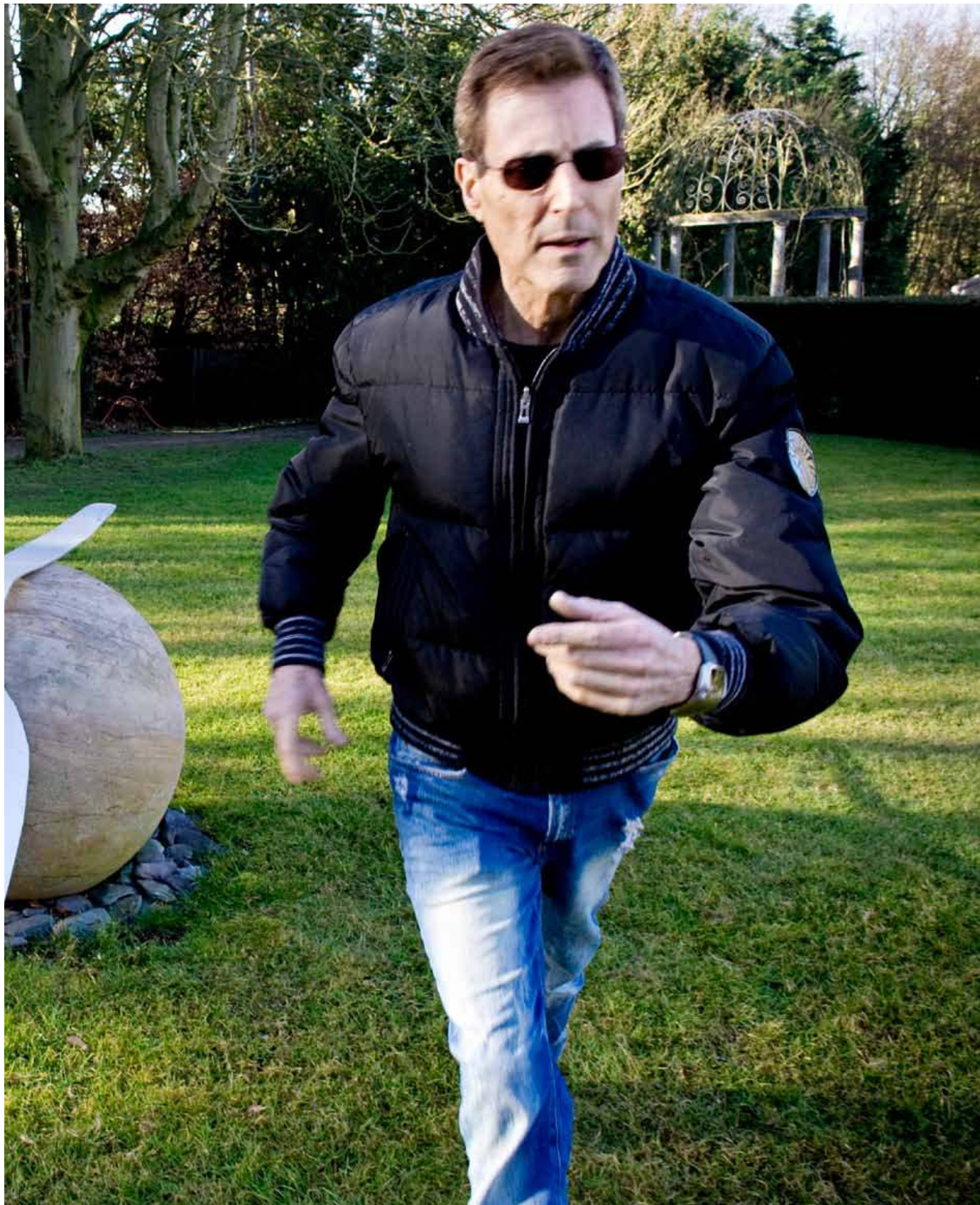
høydepunktene i det enorme hageanlegget.