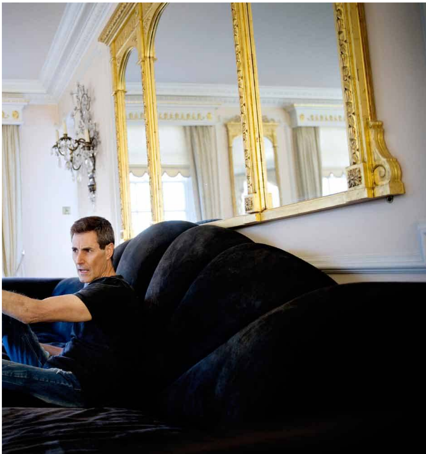
Thames. I bakgrunnen står en statue av Salvador Dalí. På stuebordet ligger hans faste følgesvenn, Blackberryn. I løpet av to timer tikker det inn 40 meldinger på telefonen.

DU TROR KANSKJE AT DETTE STUEBORDET ER FAST OG SOLID, MEN I VIRKELIGHETEN ER DET BARE EN SAMLING ENERGI SOM OPPTRER PÅ EN SPESIELL MÅTE